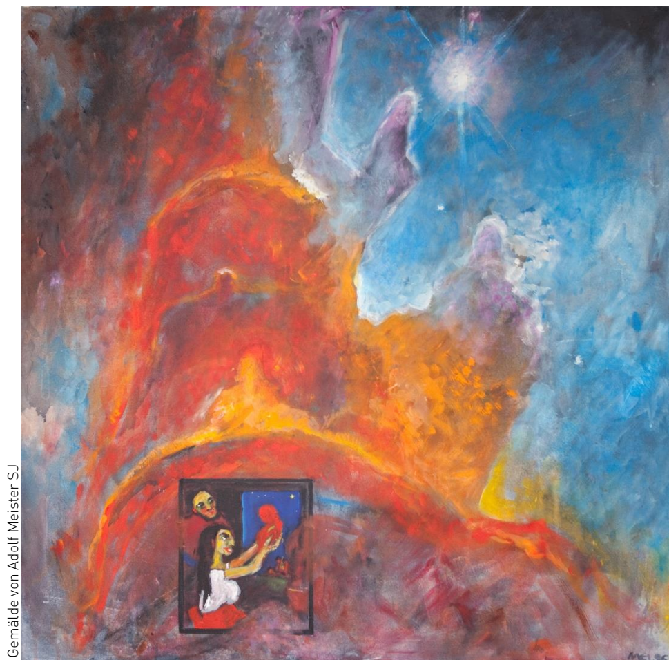
Gemälde von Adolf Meister SJ