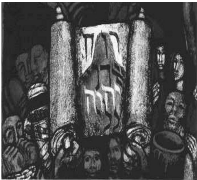
Sieger Köder: Enthüllung Fensterbild in der Hl. Geist Kirche in Ellwangen

Der Geist des Herrn ruht auf mir; denn er hat mich gesalbt. Er hat mich gesandt, damit ich den Armen die frohe Botschaft bringe; damit ich den Gefangenen die Entlassung verkünde und den Blinden das Augenlicht; damit ich die Zerschlagenen in Freiheit setze und ein Gnadenjahr des Herrn ausrufe.