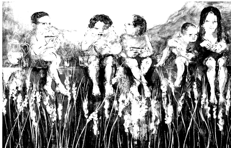
Misereor Hungertuch 2013/14, Ejti Stih