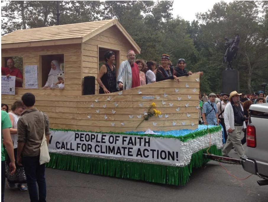
Die „Arche Noah“ beim Peoples Climate March 2014

„Die dringende Herausforderung, unser gemeinsames Haus zu schützen, schließt die Sorge ein, die gesamte Menschheitsfamilie in der Suche nach einer nachhaltigen und ganzheitlichen Entwicklung zu vereinen.“