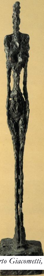
Alberto Giacometti, Stehende Frau , 1948

Der Künstler Alberto Giacometti wollte hinter den Bereich des Sichtbaren dringen und die „Wesenheit“ der Welt erfassen. Das Ringen um die wahre Gestalt, die Suche das Wesen des Menschen zu erfassen, die Reduktion auf den Kern, findet Ausdruck in seiner Skulptur der Stehenden Frau von 1948. Die rau modellierte Oberfläche unterstreicht u.a. die „nervöse Energie“ der Frau, die den unmittelbaren Raum um sie herum energetisch aufzuladen scheint. Die Figur wirkt wie ein Riss im Raum, indem alles entschwindet.... Die Betrachtung der Skulptur kann uns auf uns selber zurückwerfen: Wo stehe ich? Wie entschieden schreite ich voran? Oder halte ich bewusst inne? Was hält meine Füße klobig zurück? Wie ist mein innerer Kompass ausgerichtet? Auf was warte ich? Welche Energie strahle ich aus? Bin ich bereit?