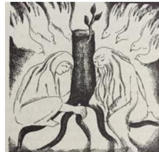
Abb. 190: Die Jesajas am Baumstumpf Isais mit den sieben Gaben des Heiligen Geistes. Die Prophetenfamilie lebte in der zweiten Hälfte des 8. Jh. v. Chr. in Jerusalem.